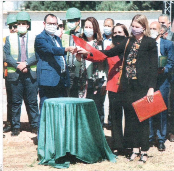
● إطلاق أشغال تأهيل 28 ثانوية بفاس مكناس

وسجل أن الأمر يتعلق بمشاريع تمت صياغتها في إطار مقاربة تشاركية تضم التلاميذ والمدرسين والسلطات المحلية والآباء مشيرا الى أن أشغال تفعيل المشروع لن تتجاوز 7 أشهر. يذكر أن كومباكت 2 ممول بمبلغ 450 مليون دولار من قبل الحكومة الأمريكية ممثلة في حساب تحدي الألفية. ويراهن المخطط الذي سينفذ وفق نموذج مختلط، حضوري وعن بعد، على التكوين الذاتي والتكوين عن بعد للفاعلين البيداغوجيين والإداريين، من خلال منصة إلكترونية. وقد تم تصميم تطبيق لتدبير التكوين من أجل تنزيل التكوينات على مختلف المستويات. وينطوي تنزيل نموذج ثانوية التحدي أيضا على تقديم دعم مندمج للمؤسسات التعليمية الثانوي المستهدفة، قصد تعزيز استقلاليتها الإدارية والمالية والنهوض بنموذج بيداغوجي متمحور حول التلميذ. ■