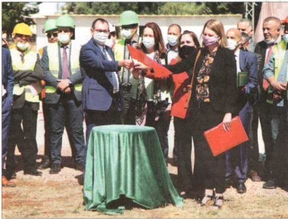
● Coup d'envoi officiel des travaux de réhabilitation de 28 établissements scolaires

La réhabilitation des 28 lycées dans la région de Fès-Meknès dans le cadre du programme Compact II porte sur l'amélioration des volets se rapportant à l'hygiène et à la sécurité, outre l'environnement des lycéens.